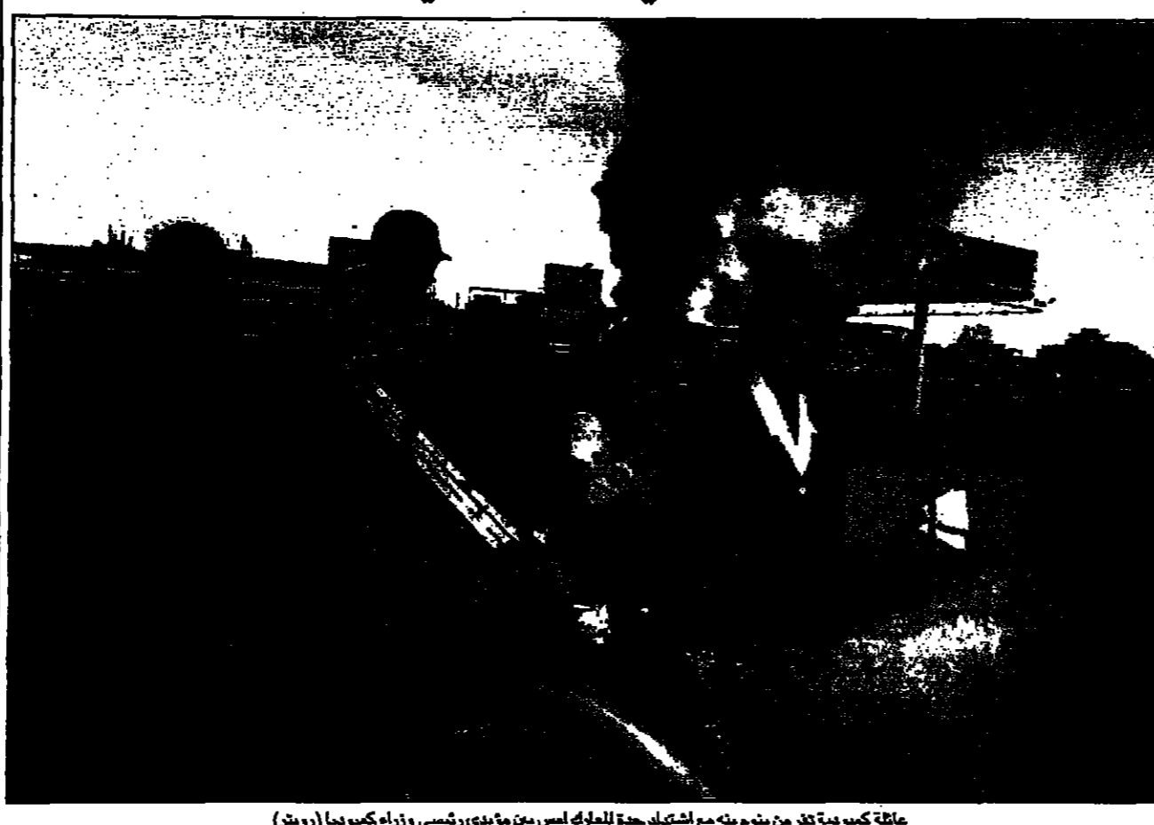
مقاتلة كمبودية تفر من بنوم بنه مع اشتداد حدة الصراع بين مؤيدي رئيس الوزراء كمبوديا (رويترز)

■ بنوم بنه - رويترز: تجدد اطلاق النار امس الاثنين في شوارع بنوم بنه بعد يومين من التوجهات العنيفة بين مؤيدي رئيس الوزراء الكمبودي وجماعة من الجيش الملكي. وقال مسؤولون في الحكومة ان القتال استمر حتى صباح امس الاثنين عندما تم سحب القوات من الشوارع. وقال مسؤولون في الحكومة ان القتال استمر حتى صباح امس الاثنين عندما تم سحب القوات من الشوارع. وقال مسؤولون في الحكومة ان القتال استمر حتى صباح امس الاثنين عندما تم سحب القوات من الشوارع.